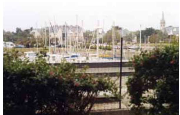
VUE SUR LE PORT