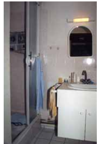
LA SALLE D'EAU