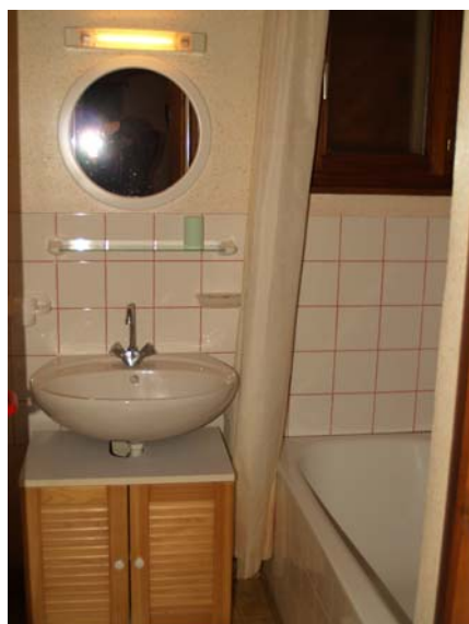
LA SALLE D'EAU